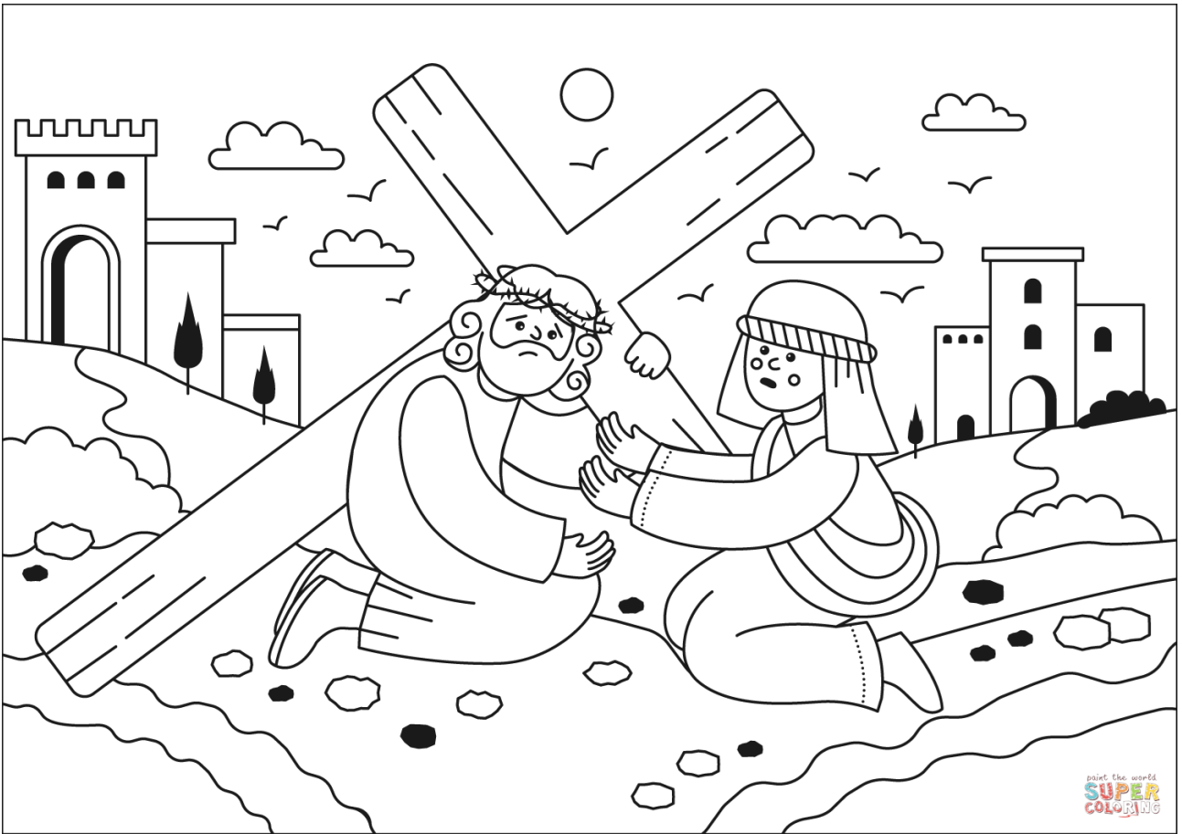
Jezus spotyka swoją matkę.