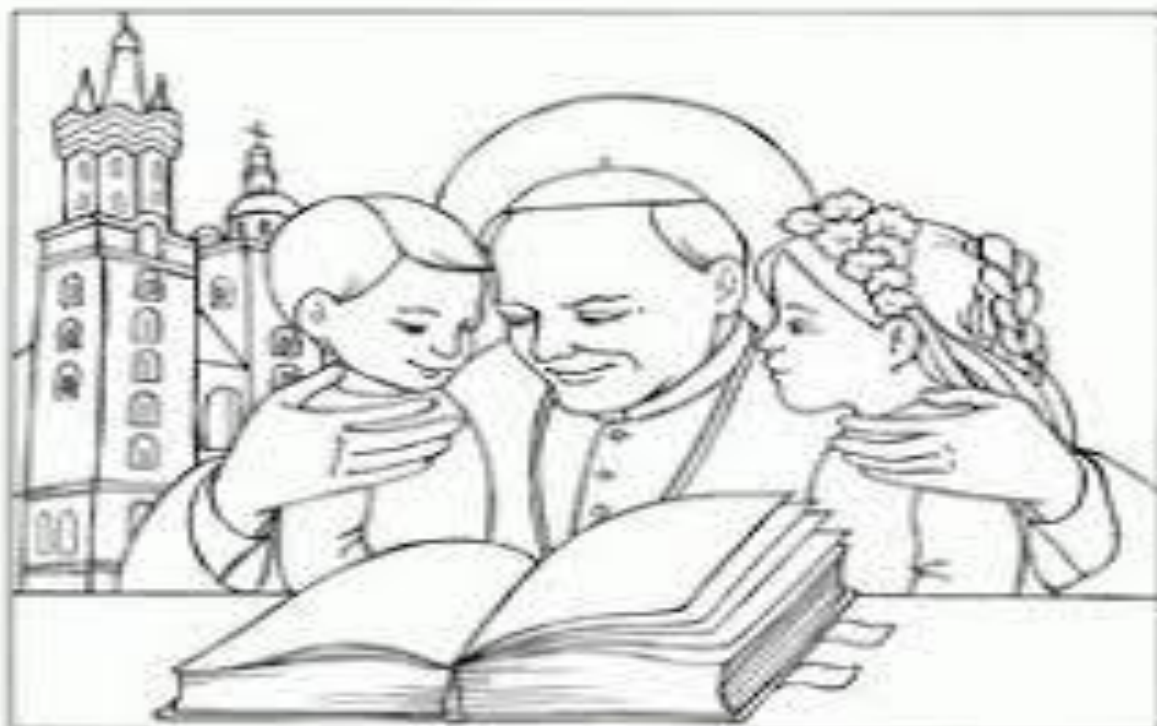
ŚWIĘTY PAPIEŻ JAN PAWEŁ II